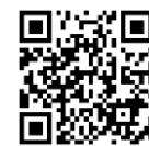
救急車利用マニュアル